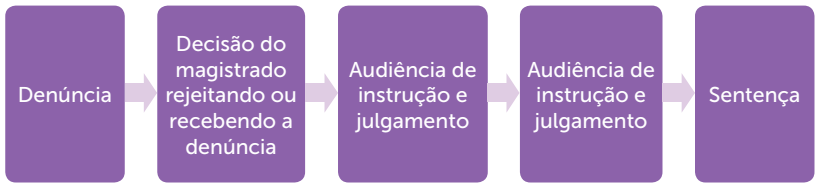
Figura 3.2 | Procedimento especial da Lei de Drogas