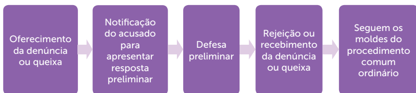
Figura 3.1 | Procedimento especial dos crimes praticados por funcionários públicos

Enfim, você viu as principais diferenças do procedimento especial dos crimes praticados por funcionários públicos em relação ao procedimento comum. Não se esqueça de que este último será aplicado subsidiariamente, hein? Logo, após apresentada a resposta preliminar e recebida a denúncia, o processo seguirá pelo rito comum.