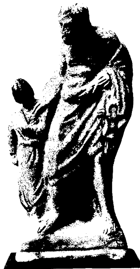
Pequenas imagens gregas de terracota retratam o escravo pedagogo conduzindo para a escola a criança.

"Só os que podem criar os seus filhos para não fazerem nada é que os enviam à escola; os que não podem, não enviam."