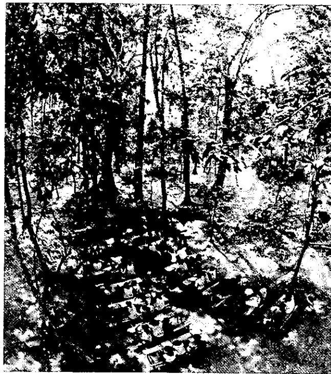
Nas "zonas libertadas" durante as lutas contra o colonialismo, uma escola na Guiné-Bissau.

A educação existe em toda parte e faz parte dela existir entre opostos. O que vimos juntos,