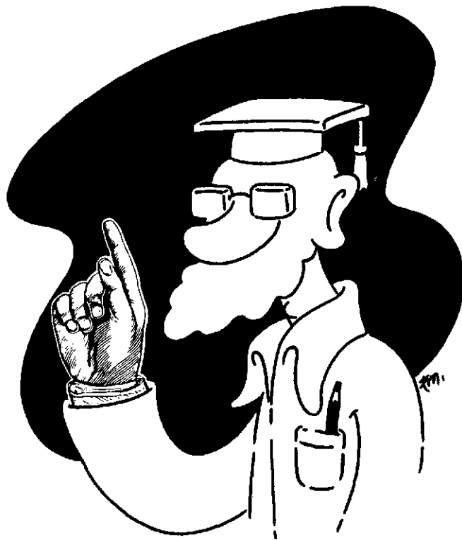
A autoridade do mestre na educação dita democrática

Então, o que parece inacreditável faz parte da própria lógica do modo como a educação existe na sociedade desigual. Quando pensada como uma "filosofia" ou uma "política de educação", ela se apresenta juridicamente como um bem de todos, de que o estado assume a responsabilidade de distribuição em nome de todos. Mas sequer as pessoas a quem a educação serve, em princípio, são de algum modo consultadas sobre como ela deveria ser. A educação que chega à favela, chega pronta na escola, no livro e na lição. Os pais favelados dos alunos são convocados a matricular os seus filhos, como se aquilo fosse um posto de recrutamento. Não são convocados, por exemplo, a debaterem com os professores como eles pensam que a escola da favela poderia ser uma verdadeira agência de serviços à sua gente. Mesmo que fossem, as suas idéias por certo não sairiam do caderno de anotações da diretoria. Mas não são só os