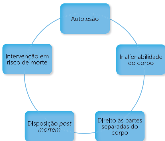
Quadro 1.3 | Limitações legais.

Voltamos então aos valores éticos, a fim de ponderar a questão da objetificação do corpo, como se fosse passível de qualquer utilização ou modificação. Por isso, o ordenamento jurídico brasileiro coíbe atos que possam comprometer o direito à vida, bem maior a ser preservado. Nessa escala de hierarquização as limitações legais são: